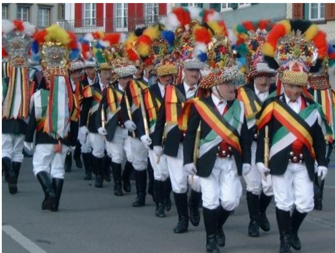
Les Röllelibutzen à Altstetten