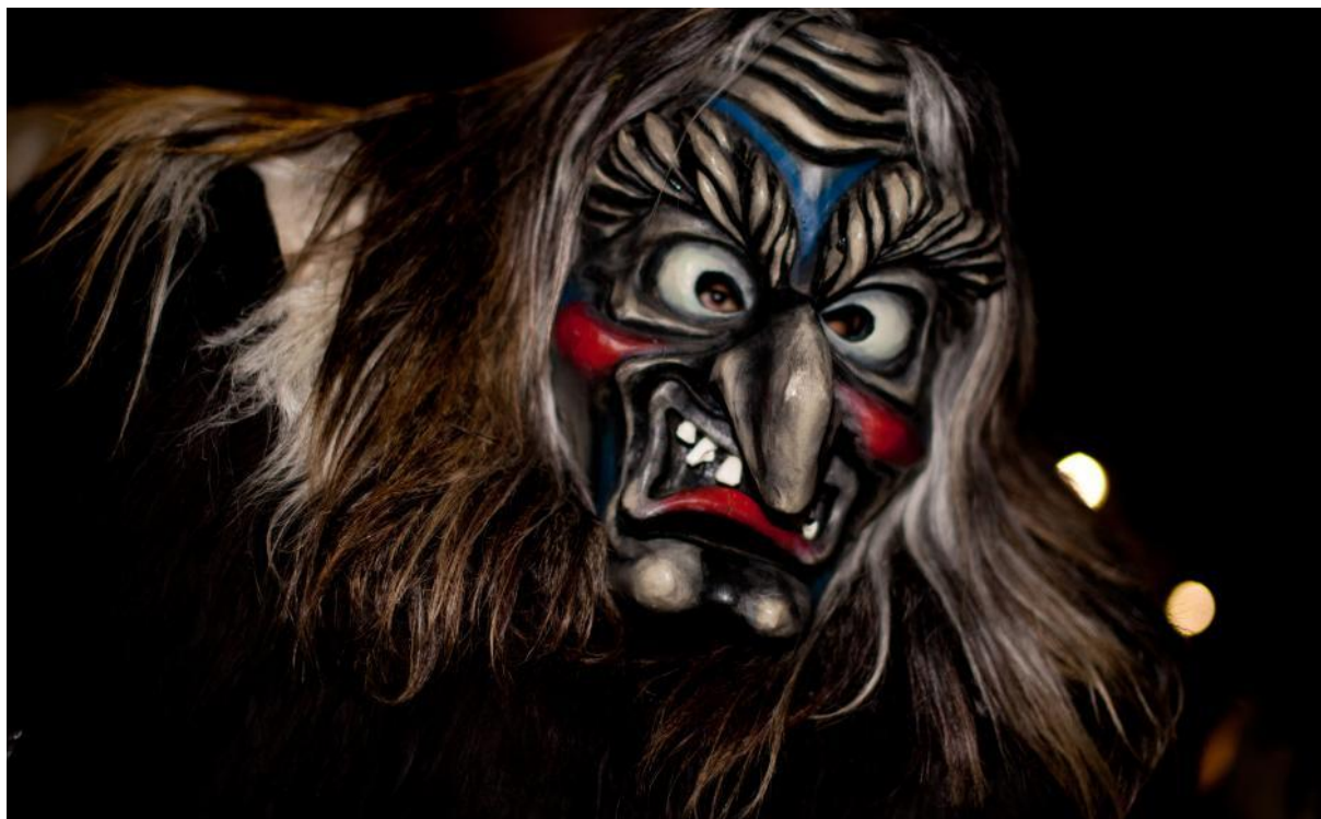
Tschägäätä dans le Lötschental (VS)

Images de carnivals suisses particuliers - pour l'amorce.