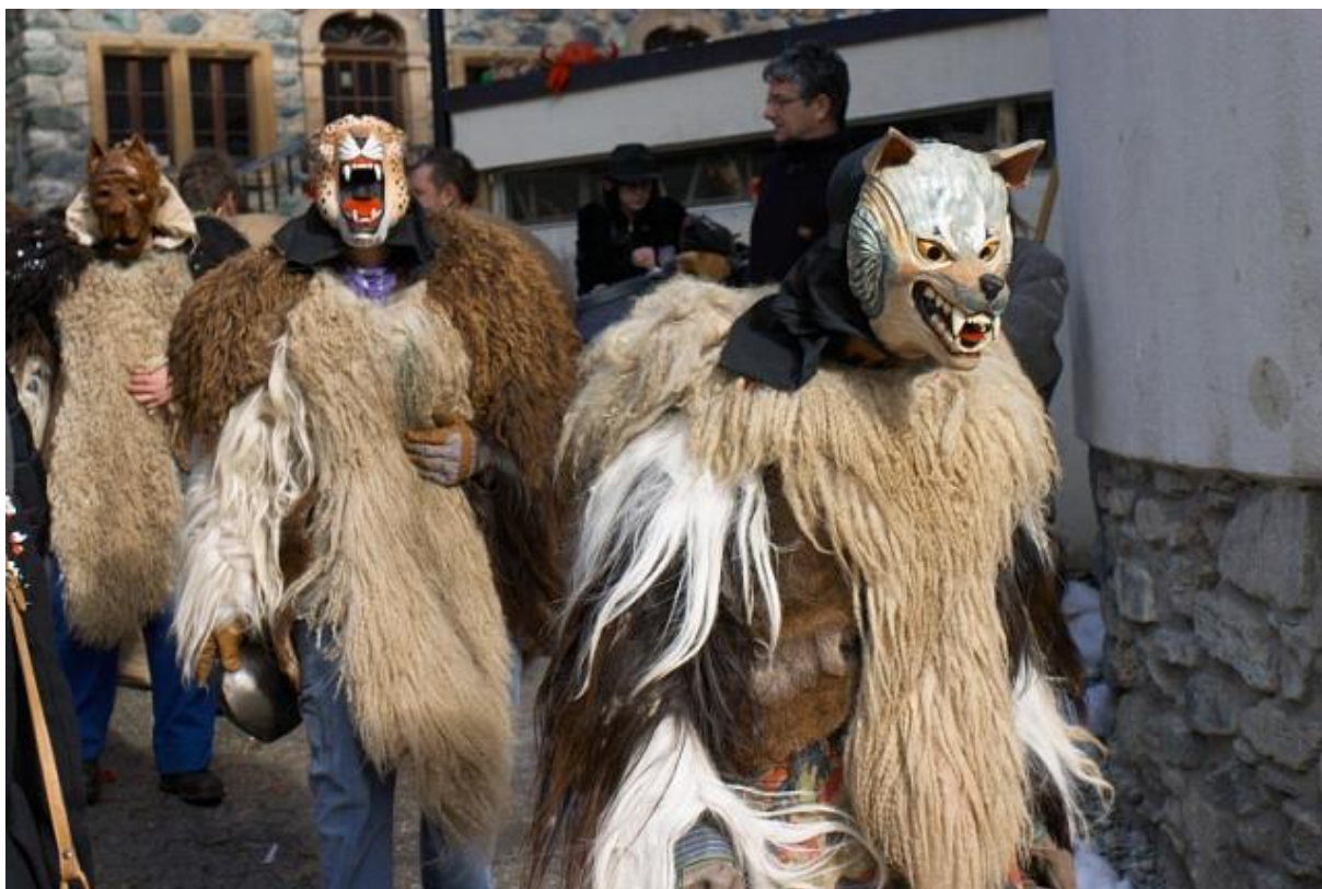
Les réveilleurs du carnaval à Evolène (VS)