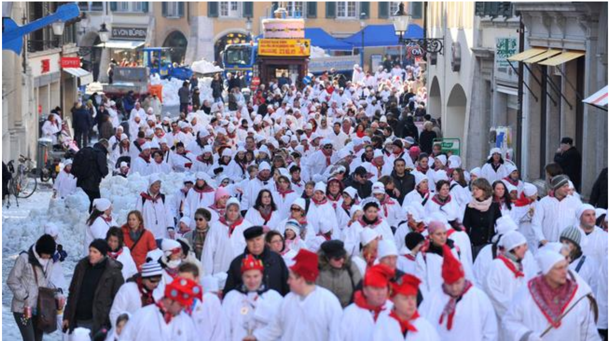
Cortège de la Chesslete à Soleure.