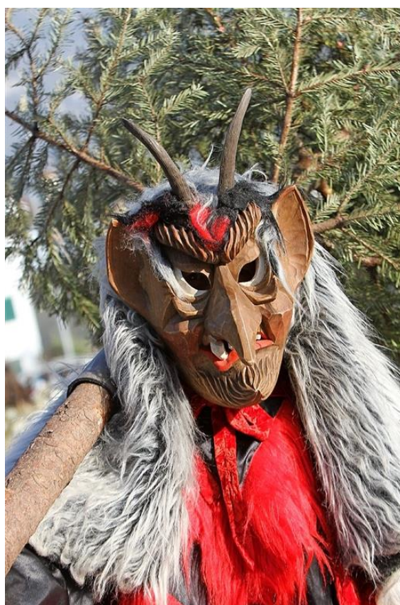
Un Butzi du carnaval à Sargans (SG)