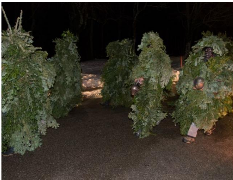
Les sauvages du carnaval au Noirmont (JU)