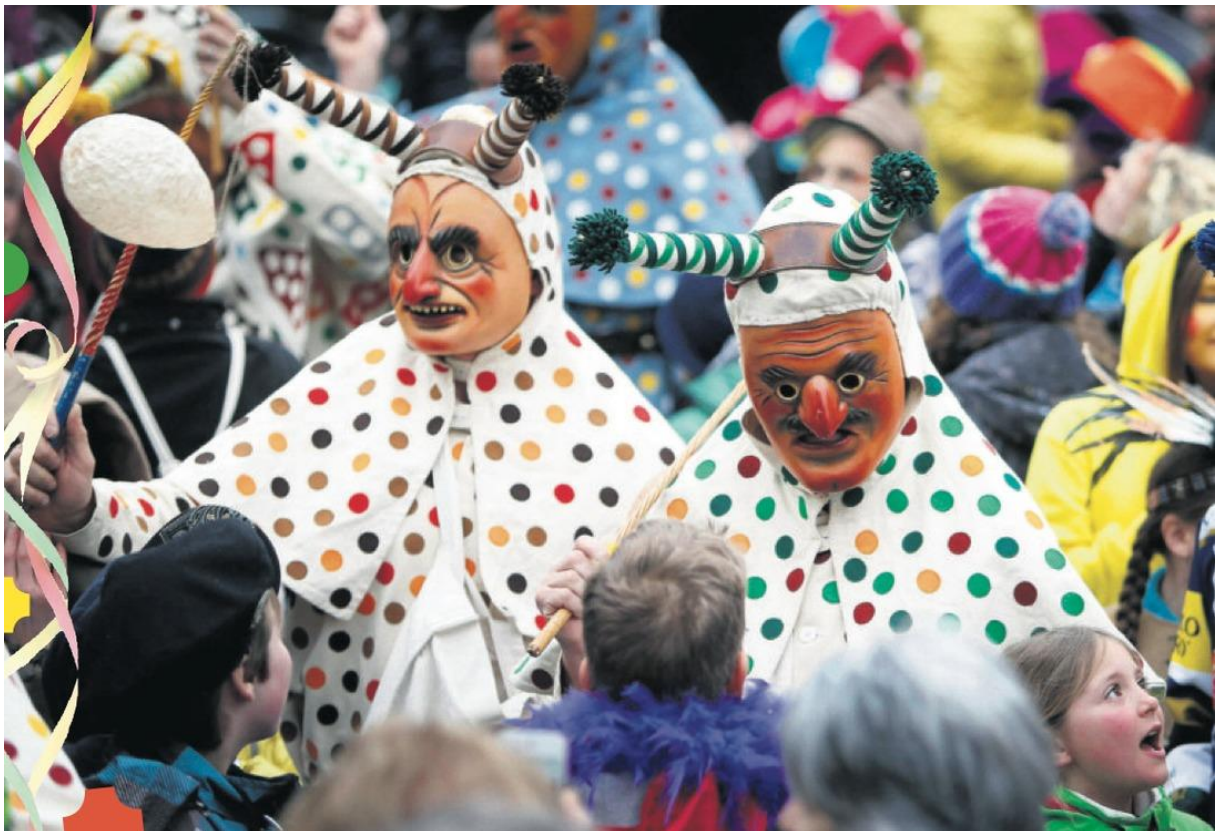
Greth-Schell du carnaval de Zug.