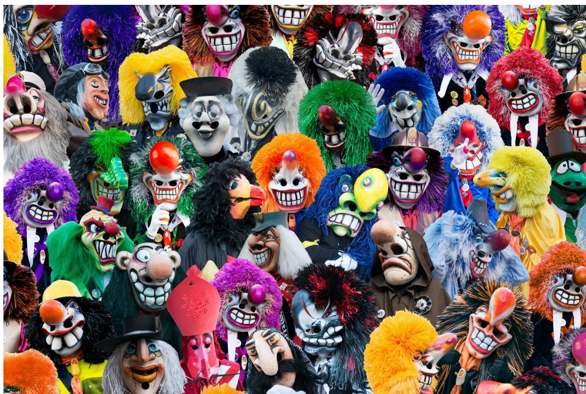
Les Waggis du carnaval de Bâle